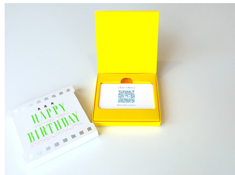
moovin POSA ギフトボックス(Happy Birthday)

国内初となる動画つき POSA カード用ギフト製品として、「moovin POSA ギフトボックス(以下ギフトボックス)」と「moovin POSA ポップアップカード(以下ポップアップカード)」の2種類を、7月29日より全国のドン・キホーテで販売開始し、順次販売店を拡大していく予定です。ギフトボックスは POSA カード収納型のボックスタイプとなり、専用の moovin ミニカード(以下ミニカード)を同梱します。また、ポップアップカードは POSA カードが収納できて自立型のポップアップカードにもなるホルダータイプとなり、同じくミニカードを同梱します。購入者は POSA カードおよび動画を付けたミニカードを、ギフトボックスまたはポップアップカードの収納箇所に挿入して贈りたい相手にプレゼントします。